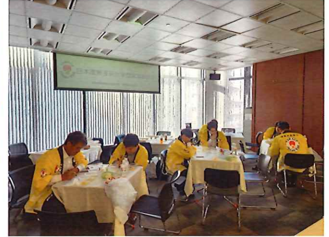
▲4カ国産鶏卵試食ワークショップ（生産者）