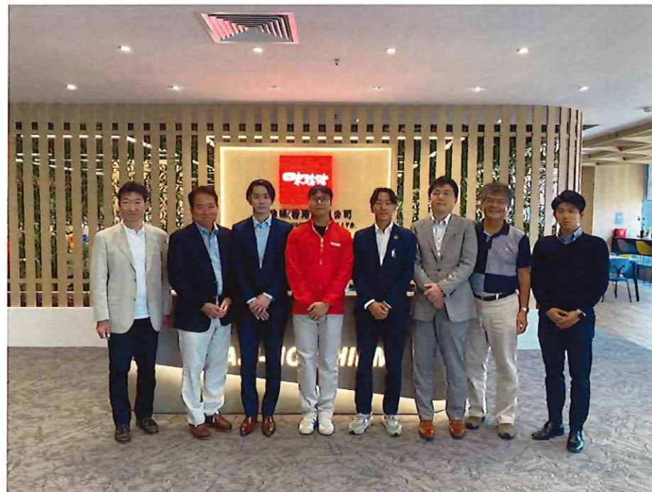
▲味の珍味訪問時写真