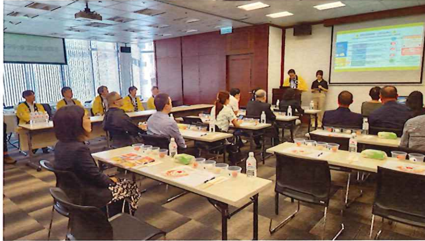
▲日本鶏卵セミナープレゼンテーション