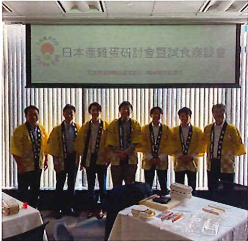
▲参加生産者集合写真