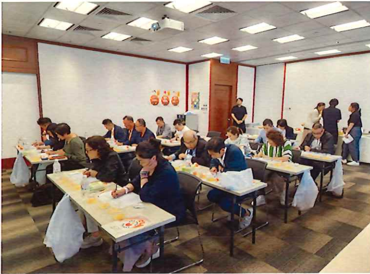
▲4カ国産鶏卵試食ワークショップ（香港バイヤー）