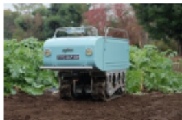
無人運搬ロボットの活用