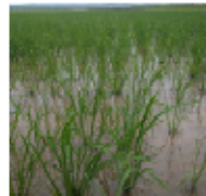
苗立ちが良いなど、 直播適性の高い品種の導入