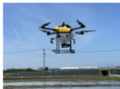
直播ドローンの活用