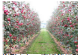
省力樹形とし、直線的に配置する ことにより、機械作業が容易に

スマート農業技術活用促進法については、 随時、新しい情報を農水省HPに掲載しますので、ご覧ください。 ◆担当：農林水産省農産局技術普及課 TEL:03-6744-2218