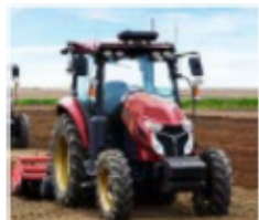
ロボットトラクタの活用