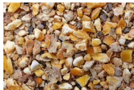
単位：円／平均トン（前四半期比較）