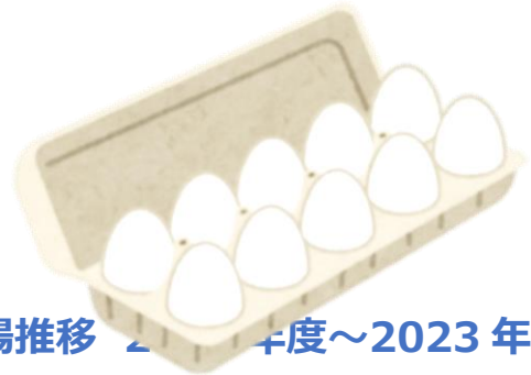
鶏卵相場推移 2013年度～2023年度

令和5年11月の鶏卵相場（東京全農Mサイズ）の高値289円は、過去10年の平均値250円を39円上回り、安値244円は、過去10年の平均値215円を29円上回っています。