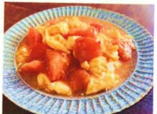
トマトの卵炒め・蕃茄炒蛋