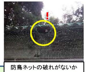
防鳥ネットの破れがないか