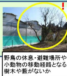
野鳥の休息・避難場所や小動物の移動経路となる樹木や藪がないか