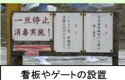
看板やゲートの設置