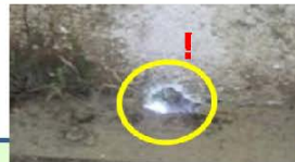
壁や床の破損がないか(外の光が漏れている所は要注意)