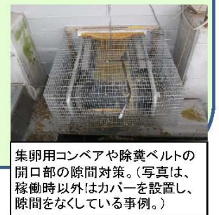
集卵用コンベアや除糞ベルトの開口部の隙間対策。(写真は、稼働時以外はカバーを設置し、隙間をなくしている事例。)