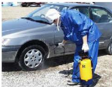
確実な車両消毒の実施