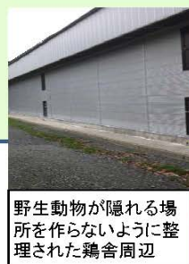
野生動物が隠れる場所を作らないように整理された鶏舎周辺