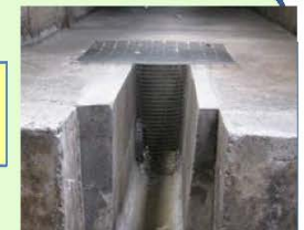
排水溝等からの侵入防止対策(鉄格子の設置)