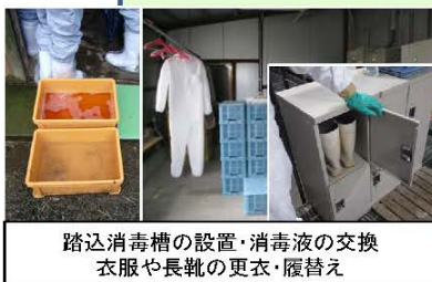
踏込消毒槽の設置・消毒液の交換 衣服や長靴の更衣・履替え